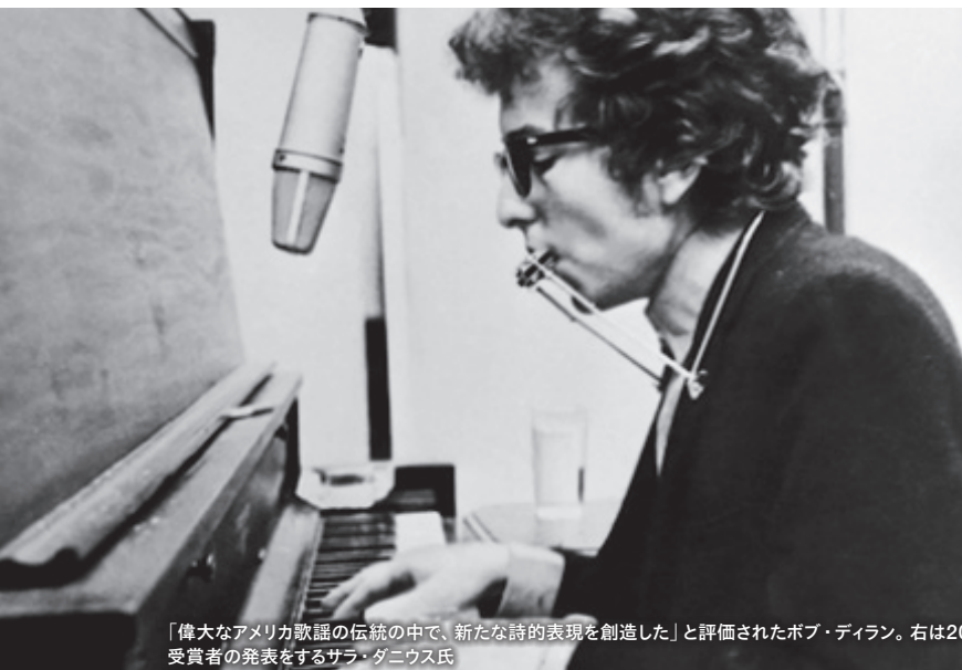
「偉大なアメリカ歌謡の伝統の中で、新たな詩的表現を創造した」と評価されたボブ・ディラン。右は2016年12月10日に行われたノーベル文学賞受賞式にて、受賞者の発表をするサラ・ダニウス氏